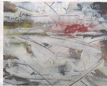
Motiv drei „Lichter im Schneesturm“ von Bernd Srienz

Voting stellen, wurden im Kreativatelier der autArKademie in Brückl gestaltet.