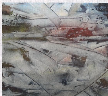
Motiv 3: „Lichter im Schneesturm“ von Bernd Srienz