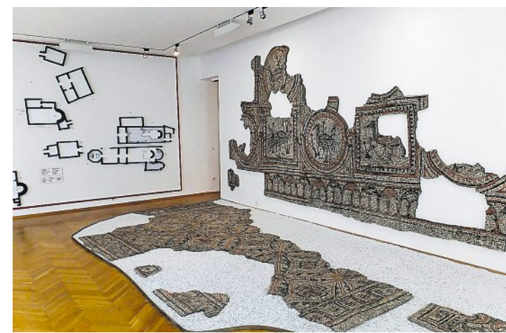
Im Archäologischen Pilgermuseum sind viele Fundstücke zu bewundern – ein Paradies für angehende Archäologen.

ben. Im Juli stehen auf dem Hemmaberg nämlich wieder Ausgrabungsarbeiten an. Gesucht werden motivierte Schüler und Studierende aus Globasnitz, die bei den Ausgrabungen helfen wollen.