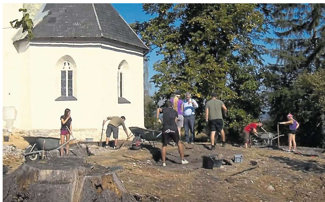
Schon vor einigen Jahren wurden Schüler eingeladen, bei den Ausgrabungen mitzuarbeiten

Werkzeug richtig hält und wie es verwendet wird. Und dass man nichts wild ausreißt, sondern freilegen muss.“ Es gibt auch eine theoretische Einführung samt Museumsführung. Geplant ist, dass je ein erfahrener Archäologe und ein Anfänger zusammen arbeiten. „Es ist gut, wenn die Jugendlichen schon einmal im Garten gearbeitet haben“, lacht Glaser. Mit dabei ist übrigens auch ein Experte, der die Ausgrabungsstätte mit einer Drohne überfliegt und so Messpunkte setzt. Glaser: „Auf viele offene Fragen kann nur die Archäologie Antworten liefern.“ Clara Milena Steiner