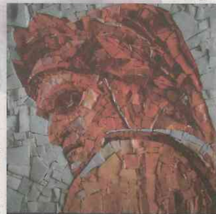
750 Jahre DANTE ALIGHIERI

Weitere Informationen im Büro der Gesellschaft oder unter www.dante-klagenfurt.at