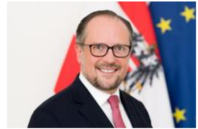
Neuer Bundeskanzler Alexander Schallenberg