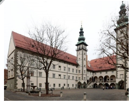
Plattform Politische Bildung

Der Wappen-Saal ist im 1. Stock im alten Gebäude vom Landhaus Klagenfurt .